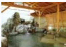
湯盛温泉・ホテル杉の湯 奈良県吉野郡川上村湯盛温泉 http://www.suginoyu.com/